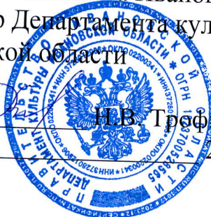
ГРАФИК проведения заседаний экспертно-проверочной комиссии Департамента культуры Ивановской области на 2024 год