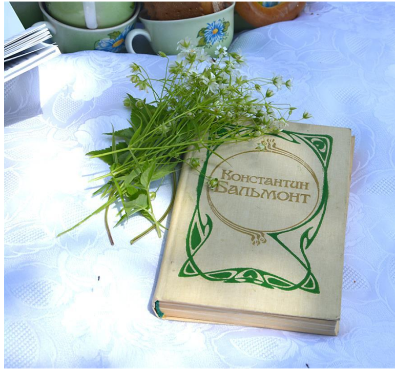
О торжествах в честь 150-летия со дня рождения поэта

Лето наконец-то стало летом. И штормовые предупреждения, которыми нас то и дело пугают синоптики, тому не помеха. Может, потому еще, что греет нас не только светило, но и стихи Константина Бальмонта. Напомним, что «вечный источник всего живого» наш знаменитый земляк воспел в книге «Будем как солнце», сотканной словно бы из лучей. Такое же название носит и литературная премия имени Бальмонта, которую вручат 14 июня.